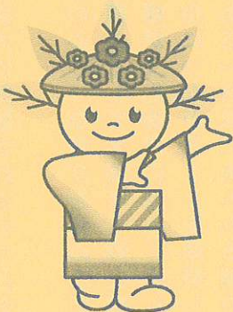
厚別区マスコットキャラクター”ピカットくん”